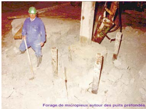
Forage de micropieux autour des puits profonds.