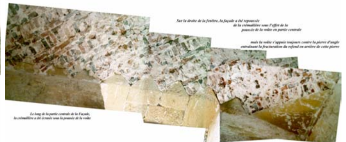
Sur la droite de la fenêtre, la façade a été réparée de la corniche sous l'effet de la poussée de la voûte en partie centrale